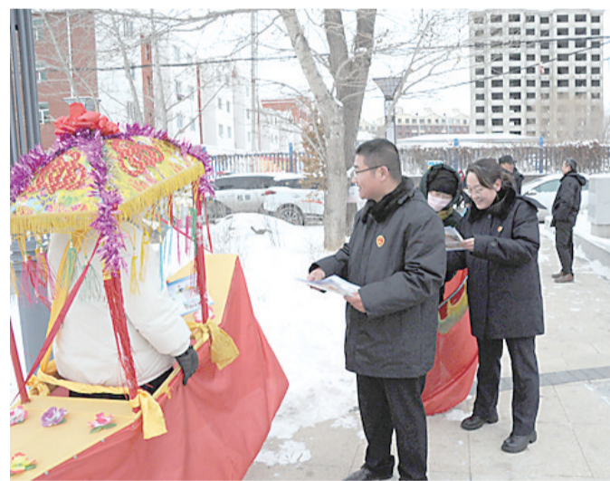
为进一步增强群众识诈防诈“免疫力”,筑牢反诈防线,2月21日,尚义县人民检察院在辖区人员密集区域开展防范电信网络诈骗普法宣传活动。活动现场,检察人员“零距离”开展普法宣传,通过悬挂条幅、发放宣传资料等方式向在场群众介绍了电信网络诈骗典型特征和常见手段,并传授了相应的识别技巧和防范举措,对群众的咨询耐心予以解答。活动共发放宣传材料300余份,接受群众咨询20余人次,取得了良好的宣传效果。

时机,对当事人释法析理:“从法律角度而言,尊重生效的判决就是尊重司法权威、尊重法律。每个公民都应该自觉履行生效判决所确定的义务。从情理角度而言,世间万物不足贵,只有情义值千金,这一生你们可还曾有过这样的知己,眼看两位老人还是古稀之年,何必计较钱财这些身外之物呢?”通过执行人员的耐心、细心、诚心地做双方当事人思想工作,最终被执行人李某偿还了李某7500元借款,案件至此执行完毕。