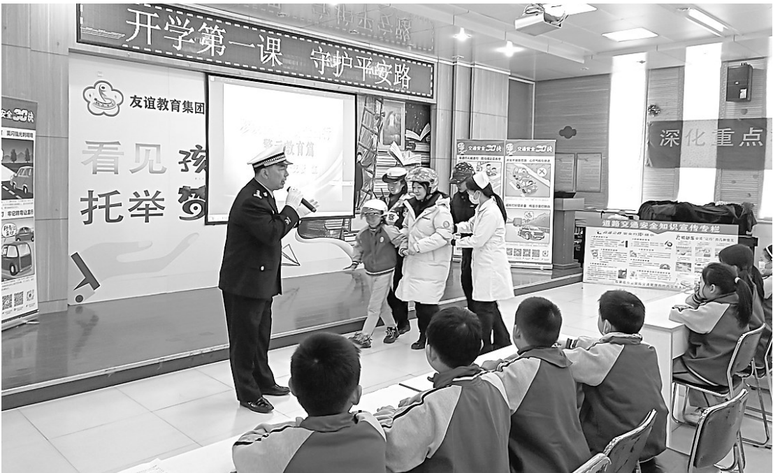
图为交警组织学生参与交通事故情景剧，并以案说法。