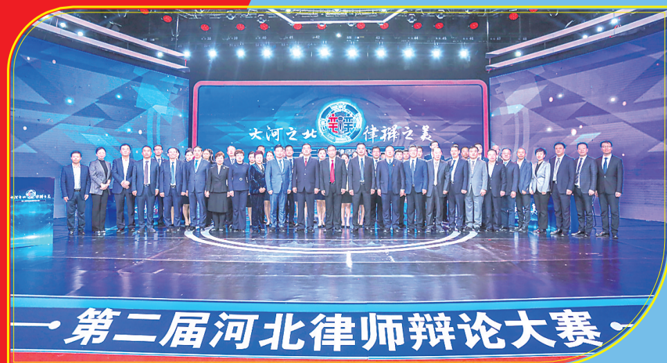
第二届河北律师辩论大赛决赛