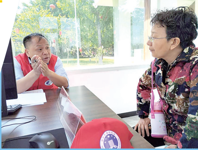
律师志愿者为群众解答法律问题