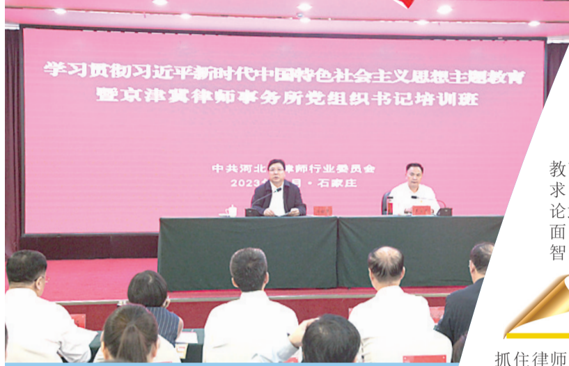
举办学习贯彻习近平新时代中国特色社会主义思想主题教育培训班

2023年10月至12月,举办了第二届河北律师辩论大赛,全省22支代表队经过一个多月的激烈角逐,紧扣辩题、唇枪舌剑,呈现了一场场精彩的视听盛宴。 封龙