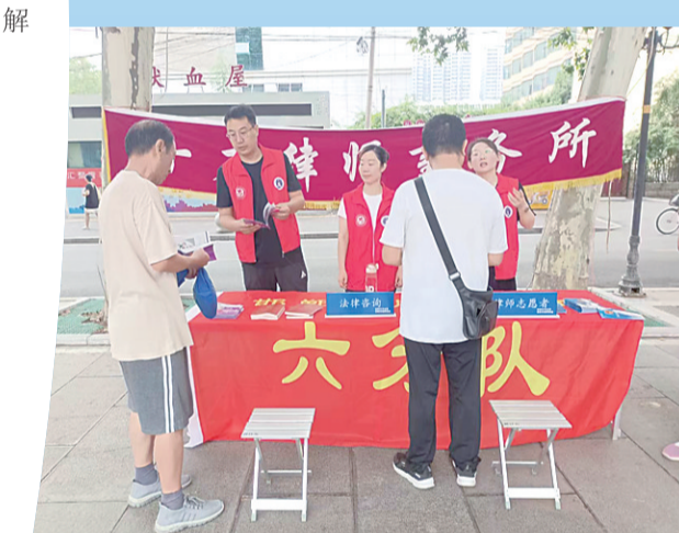
律师志愿者为群众提供免费法律咨询服务