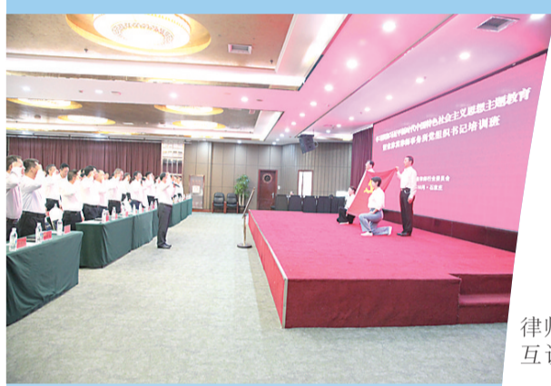
在京津冀律师事务所党组织书记培训班上进行重温入党誓词活动