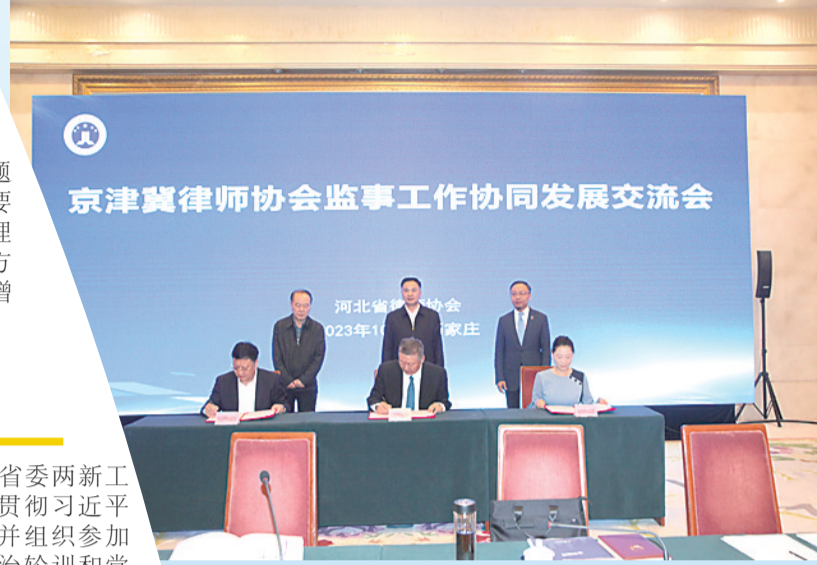
京津冀三地监事会签订合作协议