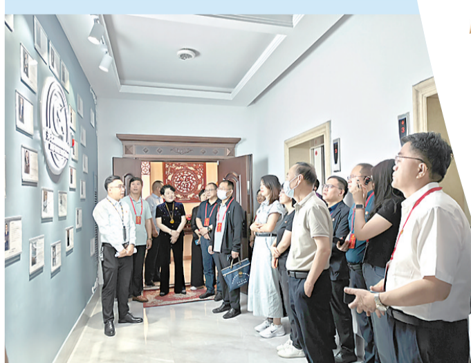
在京津冀律师行业党组织书记示范培训班上开展观摩活动