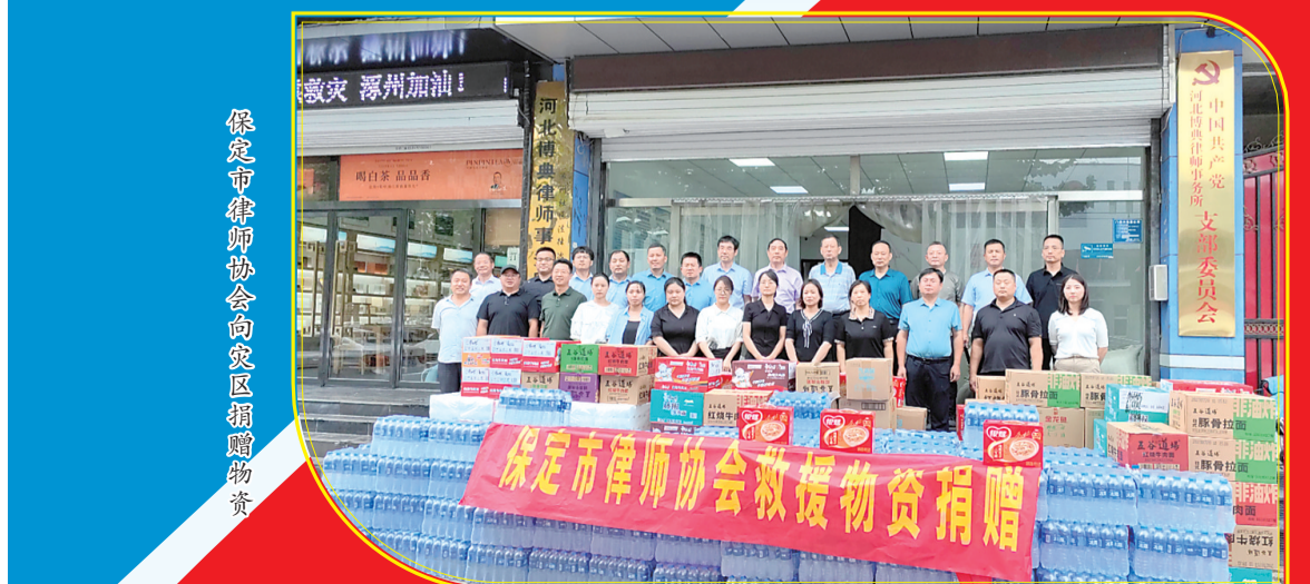
保定市律师协会向灾区捐赠物资