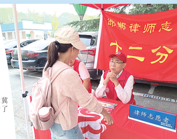
律师志愿者向群众开展普法宣传