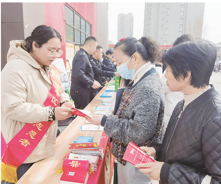
图为普法志愿者向群众普及法律法规，宣讲消费维权知识。

活动中，来自裕华区司法局、市场监督管理局的工作人员以案释法的同时，为附近商户和前来购物的消费者发放了宪法、民法典、消费者权益保护法、人民调解法读本和食品安全知识、优化营商环境政策折页等宣传资料。区市场监督管理局执法人员还为群众现场进行了食品安全监测，