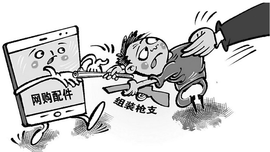
违法组装枪支，逮捕！ 新华社发 商海春 作

3月21日，案件当事人苏某向石家庄市鹿泉区人民法院宜安法庭及法官工作站赠送一面锦旗，锦旗上写着“公正调解厘是非，春风化雨暖人心”。 原来，安某因经营困难于2021年5月31日、6月9日向苏某借款共50万元，并约定了利息。到期后，苏某多次催讨，安某仅偿还部分利息。2023年12月，苏某诉至法院。 鹿泉法院宜安镇法官工 作站特邀调解员接手该案后，当即召集双方当事人开展调解。最终双方达成一致:安某分期偿还借款及利息，苏某对安某名下房产在70万元范围内享有优先受偿权。 在调解过程中，鹿泉法院宜安法庭庭长杨巧燕三次到法官工作站进行法律指导，厘清涉案金额、分期偿还起点等事项，并积极与双方当事人沟通，使这起民间借贷纠纷最终圆满化解。王帆 穆鑫玉