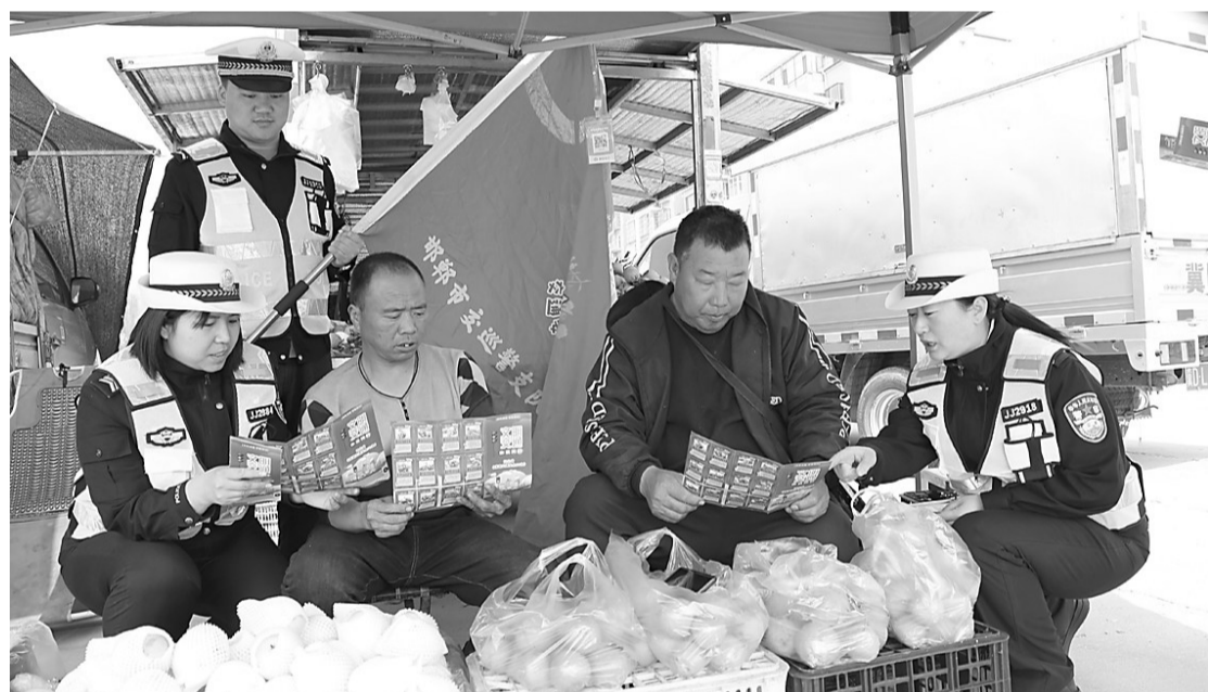
4月11日,邯郸市公安交警支队涉县大队利用台村赶集日开展“美丽乡村行”交通安全宣传活动,大力提升农村地区群众交通安全意识。图为宣传人员向摊点商贩讲解交通安全知识,并提醒他们出行牢记交通安全。

高速交警提示:应急车道是“生命通道”,任何人在非紧急情况下都不得在应急车道上行驶或停车,更不能随意占用应急车道。