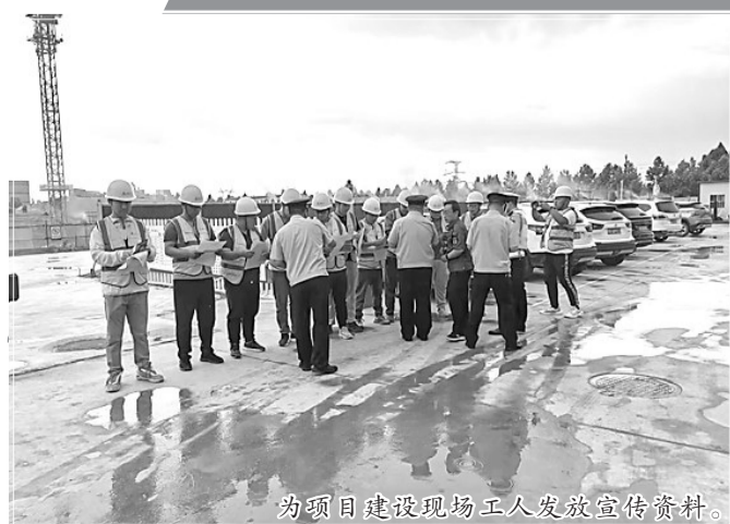
为项目建设现场工人发放宣传资料。