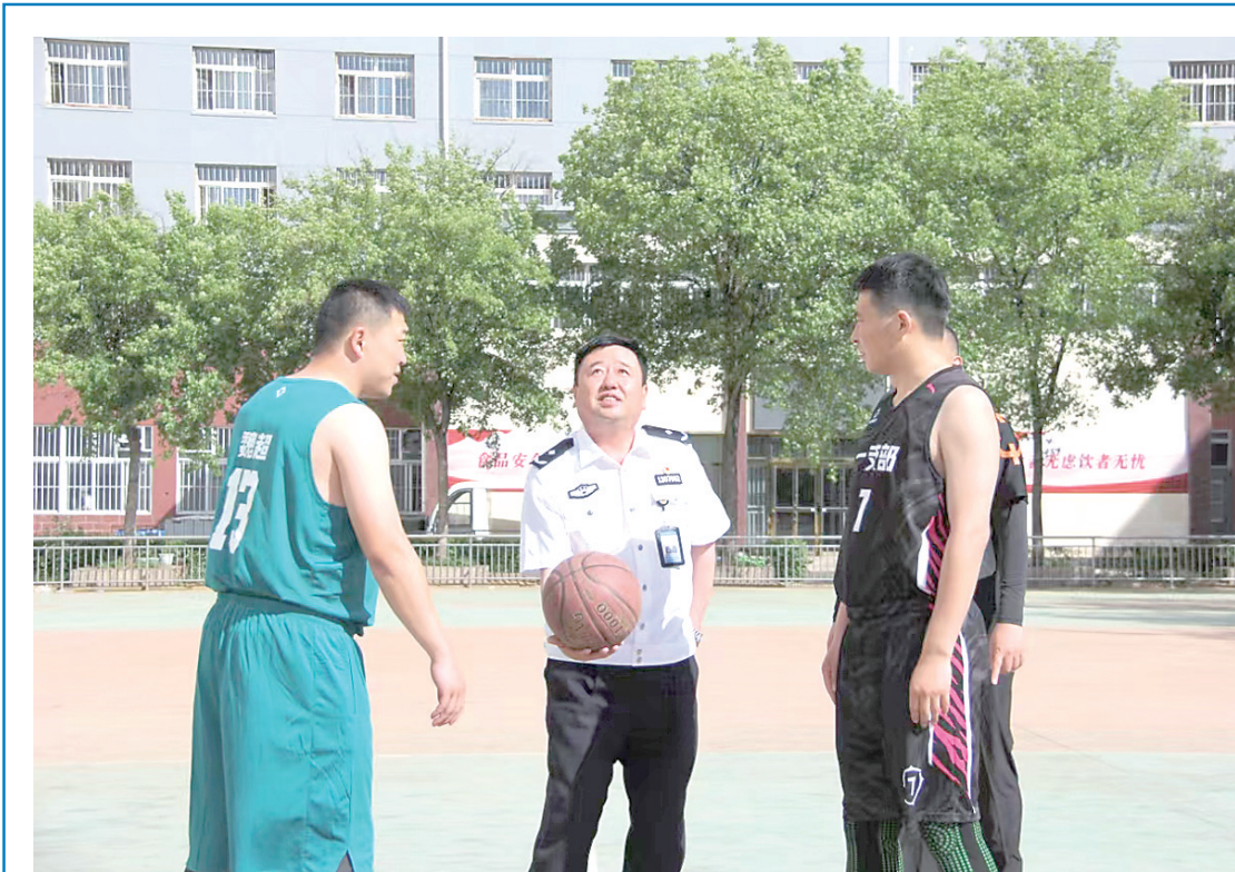
近日，承德监狱举办2024年度干警职工运动会。运动会项目包括篮球、乒乓球、羽毛球、1000米跑等8个大项。比赛中，参赛队员团结协作，奋力拼搏，展现出了承德监狱干警职工昂扬向上的精神状态。