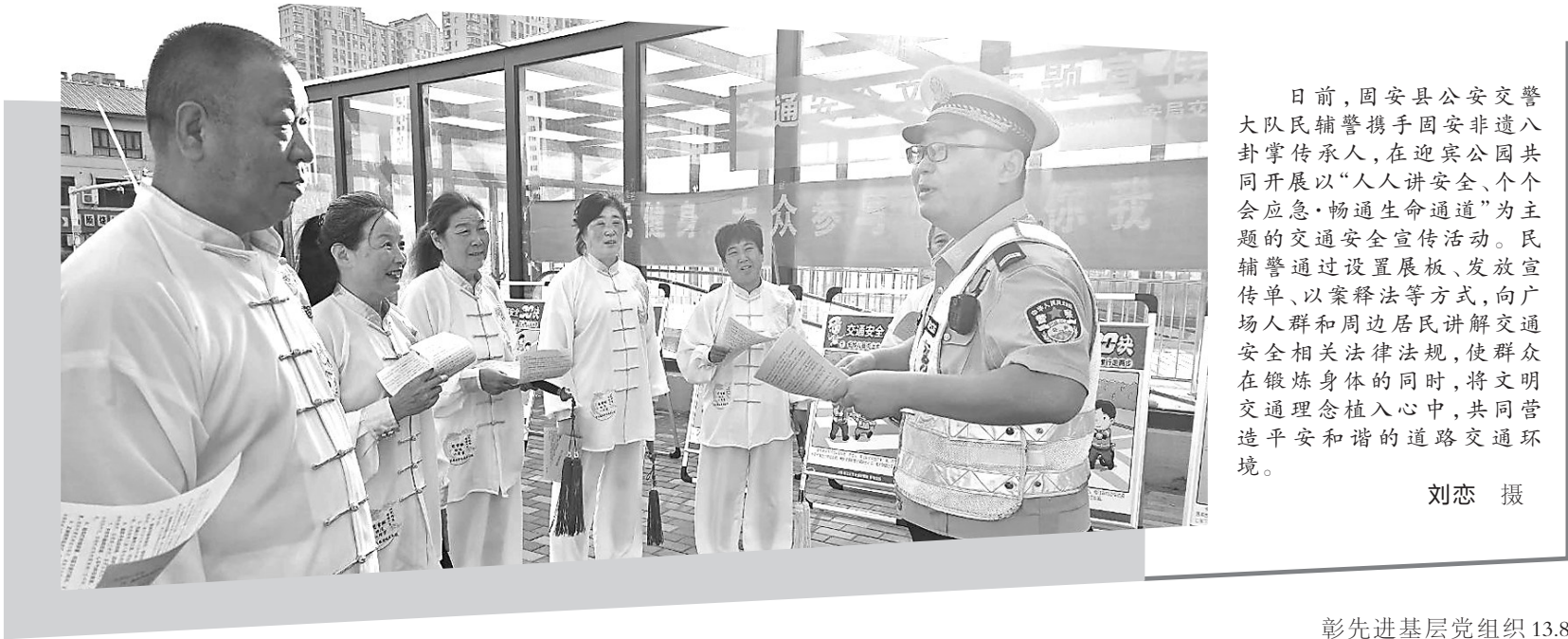
日前,固安县公安局交警大队民警携手固安非遗八卦掌传承人,在迎宾公园共同开展以“人人讲安全、个个会应急·畅通生命通道”为主题的交通安全宣传活动。民辅警通过设置展板、发放宣传单、以案释法等方式,向广场人群和周边居民讲解交通安全相关法律法规,使群众在锻炼身体的同时,将文明交通理念植入心中,共同营造平安和谐的道路交通环境。