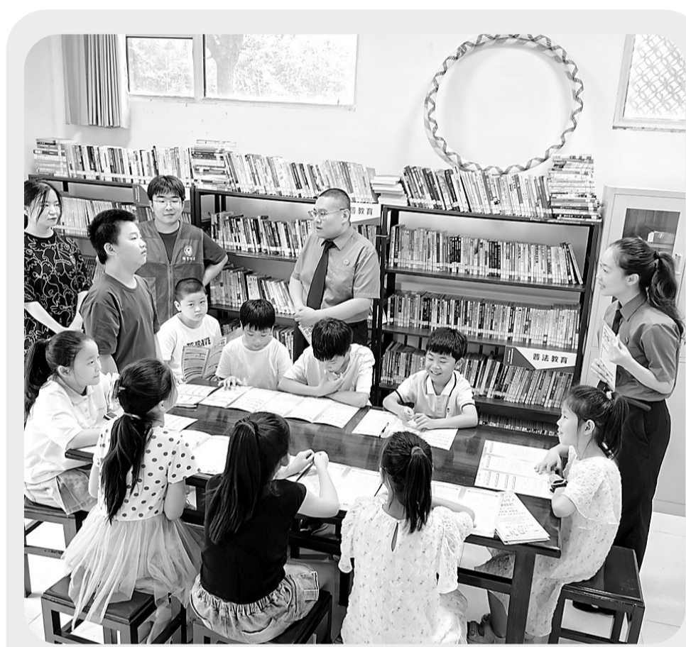
7月23日,邯郸市永年区人民检察院干警走进社区,开讲“暑期安全法治课”。活动中,检察干警采取以案说法的方式,结合校园欺凌、溺水事件、交通安全等发生在身边的一些真实案例,引导学生树立自我保护意识,学会用法律武器来维护自身合法权益,做一名尊法、学法、守法、用法的好少年。

《条例(草案)》聚焦服务保障民用航空发展,要求建立航班运行保障协调机制,对航班延误取消、大面积航班延误应对作出规定,并明确了投诉处理具体程序;对低空空域协同管理、拓展低空飞行应用场景作出规定,鼓励支持通用航空发展。同时,《条例(草案)》提出要支持机场规划建设、人才培养引进、航线培育开发、机场集疏运体系建设、信息化建设等方面做实做细各项措施,为民用航空发展提供政策支持。