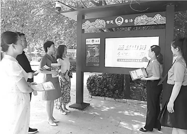
图为近日，南和区检察院邀请群众现场体验智慧法治触屏的实用性能。

为进一步展示触屏使用效果，近日，南和区检察院邀请了部分区人大代表、政协委员及周边群众前往主题公园进行参观，现场体验智慧法治触屏的实用性能。