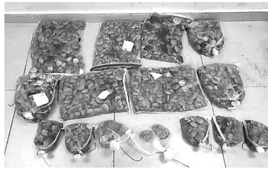
涉案红耳彩龟证据图。

当前,还有不少人对外来入侵物种的概念、危害性认识不足,对非法引进外来入侵物种构成犯罪的认识不到