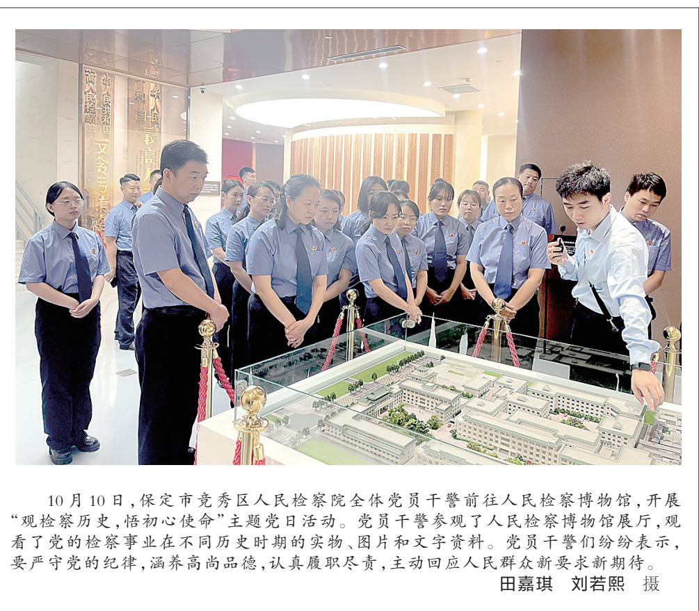
10月10日，保定市竞秀区人民检察院全体党员干警前往人民检察博物馆，开展“观检察历史，悟初心使命”主题党日。党员干警参观了人民检察博物馆展厅，观看了党的检察事业在不同历史时期的实物、图片和文字资料。党员干警们纷纷表示，要严守党的纪律，涵养高尚品德，认真履职尽责，主动回应人民群众新要求新期待。

深刻回答了我们为什么必须紧紧围绕推进中国式现代化进一步全面深化改革的问题。《决定》指出，继续把改革推向前进，是“坚持和完善中国特色社会主义制度、推进国家治理体系和治理能力现代化”的必然要求，是贯彻新发展理念、更好适应我国社会主要矛盾变化的必然要求，是坚持以人民为中心、让现代化建设成果更多更公平惠及全体人民的必然要求，是应对重大风险挑战、推动党和国家事业行稳致远的必然要求，是推动构建人类命运共同体、在百年变局加速演进中赢得战略主动的必然要求，是深入推进新时代党的建设新的伟大工程、建设更加坚强有力的马克思主义政党的必然要求”。《决定》所提出的“三个面对”和“六个必然要求”，从制度建设、发展理念、价值立场、风险挑战、大国担当、党的建设等方面多角度阐述和强调了进一步全面深化改革的重要性必要性，既有政治高度，又有战略高度；既有历史深度，又有世界广度，对于全面推进中国式现代化，为其提供强大动力和制度保障具有重大意义。 记者：《决定》中提到“国家安全是中国式现代化行稳致远的重要基础”，请问廊坊市将如何推进总体国家安全观的落地见效？ （下转第2版）