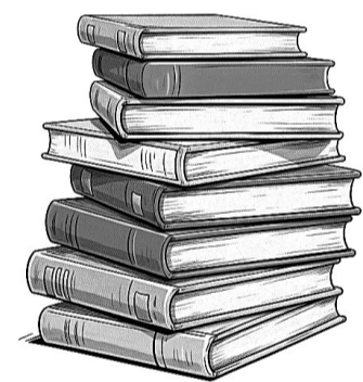
本版图片AI制作:张乔