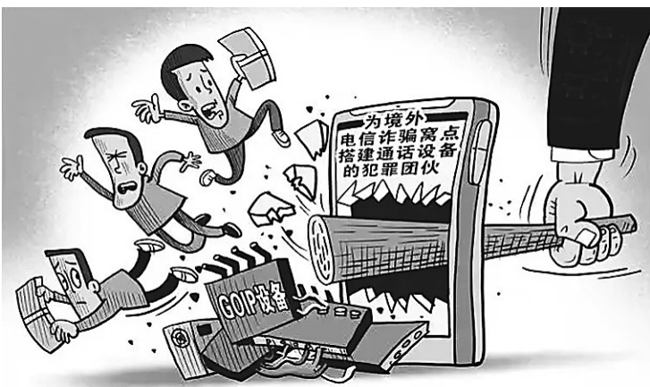
打掉 新华社发 朱慧卿 作

话机 2 部，PLC 插片式光分路器 2 部，吉比特无源光纤接入用户端设备 8 部。莲池检察院提前介入案件，就举证方向、电子数据固定等方面提出相关侦查意见。在审查起诉阶段，该院开展跨区域合作，固定关键性证据，依法以涉嫌帮助信息网络犯罪活动罪对犯罪嫌疑人黄某、陈某提起公诉。 日前，当地法院经审理，以被告人黄某犯帮助信息网络犯罪活动罪，判处有期徒刑一年七个月，罚金 2 万元；以被告人陈某犯帮助信息网络犯罪活动罪，判处有期徒刑一年三个月，罚金 1 万元。 检察官提醒：“GOIP”通过将网络与传统的电话线路连接，能够将虚拟的网络信号转化为电信信号，进而让骗子通过这些设备隐藏身