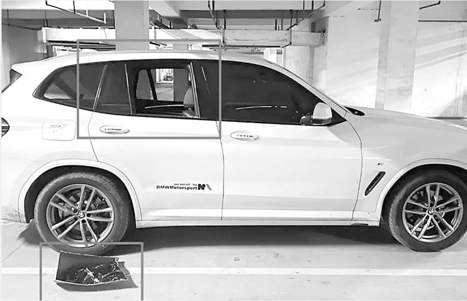
图为被犯罪嫌疑人破坏的车辆。

经讯问，三名犯罪嫌疑人对砸汽车车窗盗窃车内财物的作案事实供认不讳。据交代，三人没有正当职业，又手头拮据，便萌生了盗窃的想法。2024年12月，三人打车100多公里来到高阳县，在某居民小区内连续砸碎多辆汽车玻璃，盗窃车内香烟和现金。目前，案件正在进一步侦办中。