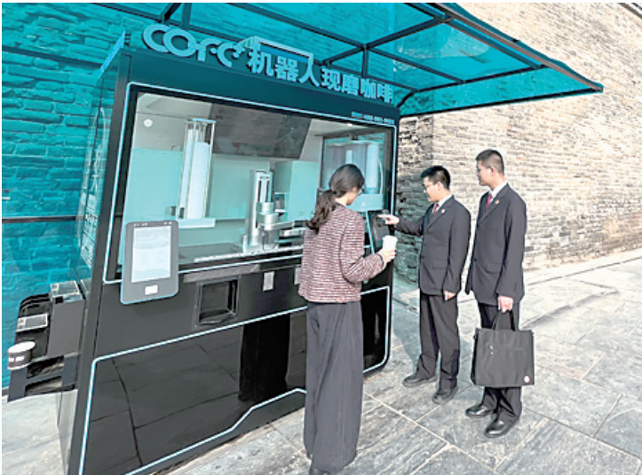
图为3月11日，检察干警开展“回头看”时向消费者介绍机器人咖啡机信息公示情况。

2024年12月26日，机器人咖啡机经营者依法完成整改，在透明橱窗基础上，增设了电子监管视窗：原料批次扫码可溯、消毒记录云端可视、投诉通道一键直连。在检察机关助推下，监管部门运用物联网技术对机器人咖啡机实行“呼吸式监管”，实时形成“数字消毒日