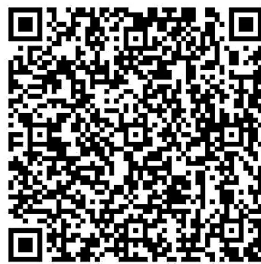
扫码观看视频 《检察官和您聊聊“隔辈带娃”那些事儿》

法，帮助祖父母或外祖父母提升教育能力；政府部门应加大对家庭教育指导服务的投入，完善相关政策法规，鼓励社会组织开展更多家庭教育公益活动。河北省创新教育学会学生发展指导分会常务副理事长赵恒智建议，依托社区建立的常态化家庭教育指导服务站，通过专业团队为祖辈家长开设隔代教育课程，同时建立父母责任督导机制，将家庭教育指导纳入基层社会治理体系，社会各方力量齐心协力，共同推动优化未成年人家庭成长环境，一起守护未成年人健康成长。(文中未成年人均为化名)