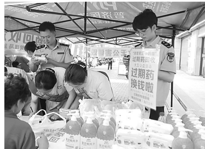
连日来,固安县市场监督管理局开展以“药品安全 监管为民”为主题的“全国药品安全宣传周”活动。工作人员通过进社区、进村街、进商超、进市场、进企业,以及利用网络、大屏幕、张贴海报等方式宣传普及药品监管法律法规和用药知识。图为9月1日,该局联合药品经营企业对过期药品进行回收。

以司法之力夯实诚信之基,我省法院构建的执行诚信治理体系,不仅是破解执行难题的实践创新,更是推进社会治理现代化的生动注脚。省法院相关负责人表示,下一步将持续深化执行协同,探索和推广更完善、更便利的守信激励和信用修复措施,以制度创新完善信用闭环,推动社会诚信体系建设。