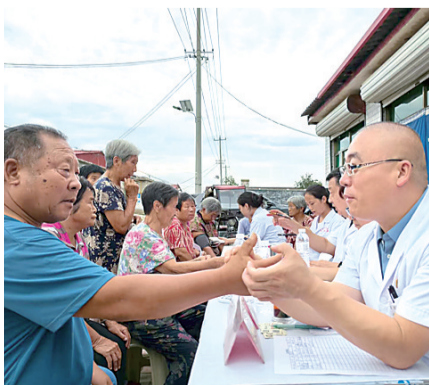
图为新乐市中心医院近期开展志愿服务,受到老人们的欢迎。文/图 谢敬辉

该院持续开展“党建+医养服务”主题活动,组织党员与老人结对志愿帮扶,定期走进医养中心探访、陪老人聊天、为老人解决实际困难,让老人感受到党组织的关怀和温暖。同时,深入社区、乡村普及健康养老知识,定期组织医护人员为社区老人进行免费体检、健康咨询,将医养服务延伸到基层,使更多老年人受益。