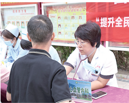
图为义诊活动现场。文/图 席娟

今年以来,任丘市人民医院将包联共建工作作为践行社会责任的直接载体,深入推进包联全覆盖工作,服务网络覆盖347个村庄、39个社区及25个基层医疗卫生机构。该院依托包联纽带,推动医护力量下沉,精准对接群众就医问诊、健康咨询等需求,常态化开展义诊、健康知识讲座等活动,将健康服务送到群众家门口,切实打通服务“最后一公里”,真正实现健康服务“零距离”。