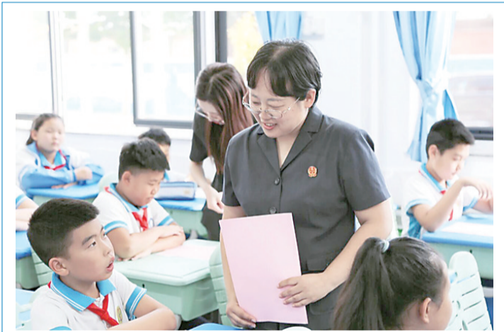
近日，昌黎县人民法院“玫瑰香”法治宣讲团成员来到泥井镇中心学校，通过互动问答的方式，向同学们讲解了校园欺凌、网络安全、家庭教育等方面的法律知识，为同学们开展了一次兼具实用性与趣味性的法治宣传活动。图为宣讲团成员与孩子互动。

播撒法治种子，奏响法治声音。该院深耕普法宣传领域，以法律“六进”为抓手，全面开展“送法进校园”活动，不定期深入村街社区普法，以新媒体平台为依托，宣传工作动态、典型案例等，增进群众对法院工作的了解理解、信任支持。建立重大典型案件开庭审理公告制度，广泛发布开庭信息，邀请群众参与旁听，以公开透明促进司法公正。深入开展“送法进企业”走访调研活动，全院32名员额法官到县内60余家重点企业走访调研，提供精准司法服务，助力优化法治化营商环境。