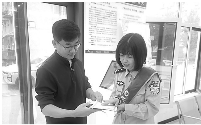
图为近日，唐山市公安局路北分局钓鱼台派出所综合服务大厅内，民警为群众答疑。

路北分局主动靠前服务，各综合服务窗口或大厅专门安排“引导员”，在群众等待办事的空当，询问群众业务需求，告知所需材料，对材料完整性、规范性进行预审核，从源头上保障群众业务“一次办好”。办事员根据群众业务需求，积极主动为办事群众提供流程指引，避免群众因流程不熟悉耽误时间，保障业务办理规范高效畅通，同时，在回执