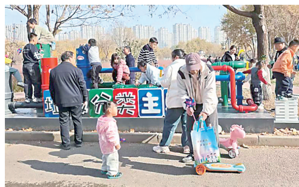
图为市民在宝云公园学习垃圾分类知识。

通过将垃圾分类知识融入市民日常休闲场景，相信该主题区将会实现“润物细无声”的科普效果，有效提升公众垃圾分类意识和参与能力。