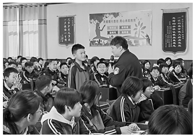
图为民警与学生进行互动。