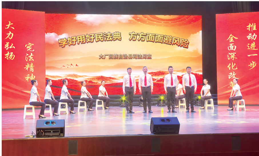
图为廊坊市司法局举办“宪法宣传周”法治文艺汇演。(资料图片)

打造政府网站、微信公众号、抖音等多元普法阵地，累计创作拍摄普法宣传片、栏目剧、短视频数百部。其中，《动漫说法》法治文化特色品牌获评河北省2022年度“十大法治成果”，并在新华社“全民普法40年回眸”专题报道中获得肯定；“通武廊普法矩阵”专栏围绕区域发展需求，同频宣传法律法规及典型案例，形成宣传合力。